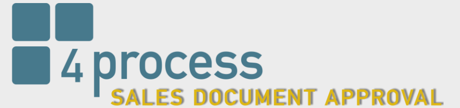
ABBILDUNG IM SYSTEM